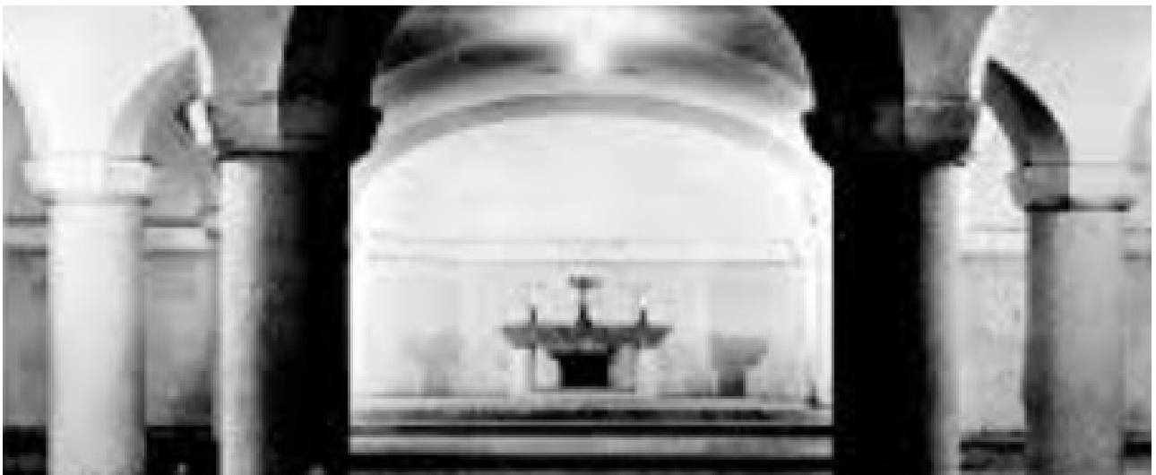
Dans la crypte du Sacré-Cœur