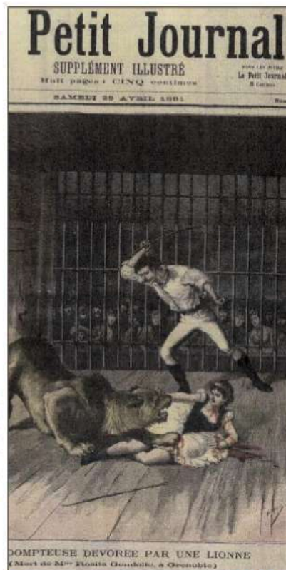
DOMPTEUSE DEVOREE PAR UNE LIONNE (Mort de M lle Rosita Gandolfo, à Grenoble)

(1) La foire des Rameaux a été officialisée, sous ce nom, en 1870 par le Conseil de la ville de Grenoble. Elle s'est tenue à l'emplacement du Jardin de ville, cours Saint-André, place Saint-Bruno et depuis 1934 sur l'Esplanade, territoire qui appartenait, il y a des lustres, à la ville de Saint-Martin-le-Vinoux