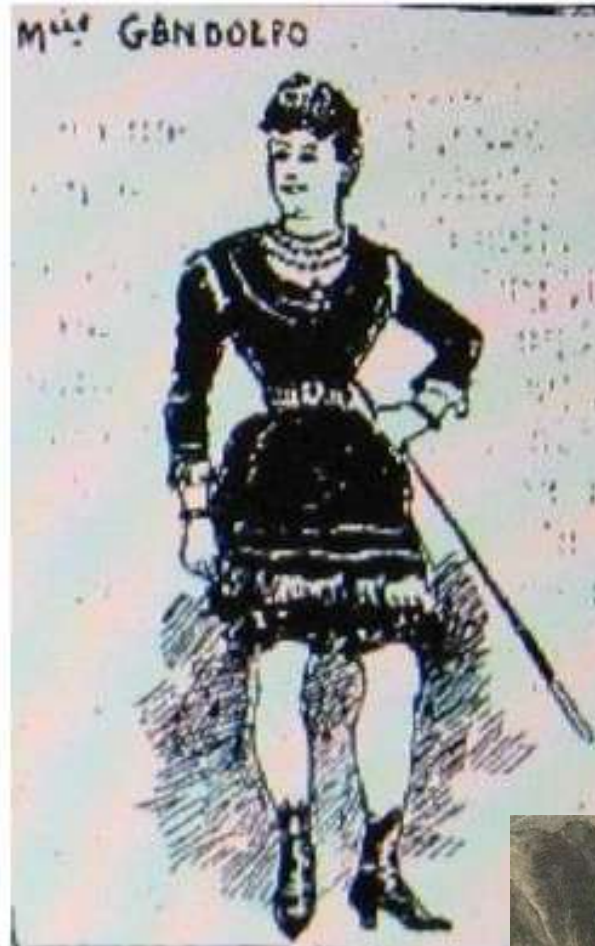
Croquis d'Augustine Gandolfo paru dans le Progrès illustré du 19 avril 1891 et exposé dans les foires après sa mort.

Le Petit journal illustre du 25 avril 1891 Mort de Rosita Gandolfo