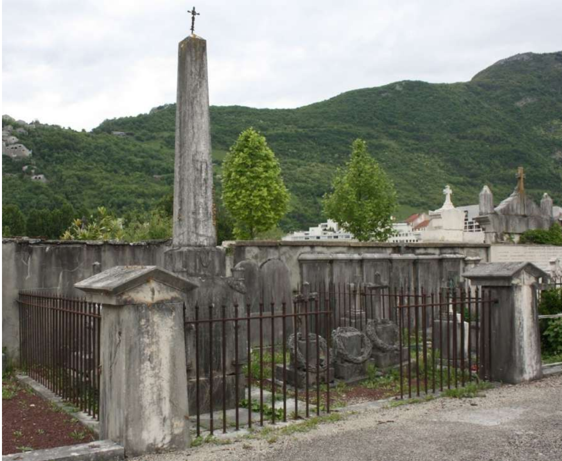
Joachim-Jérôme Quiot du Passage