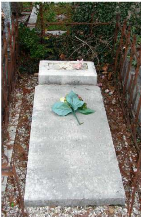
Emplacement au cimetière : Carré 5 - Rang 13 - n° 2832