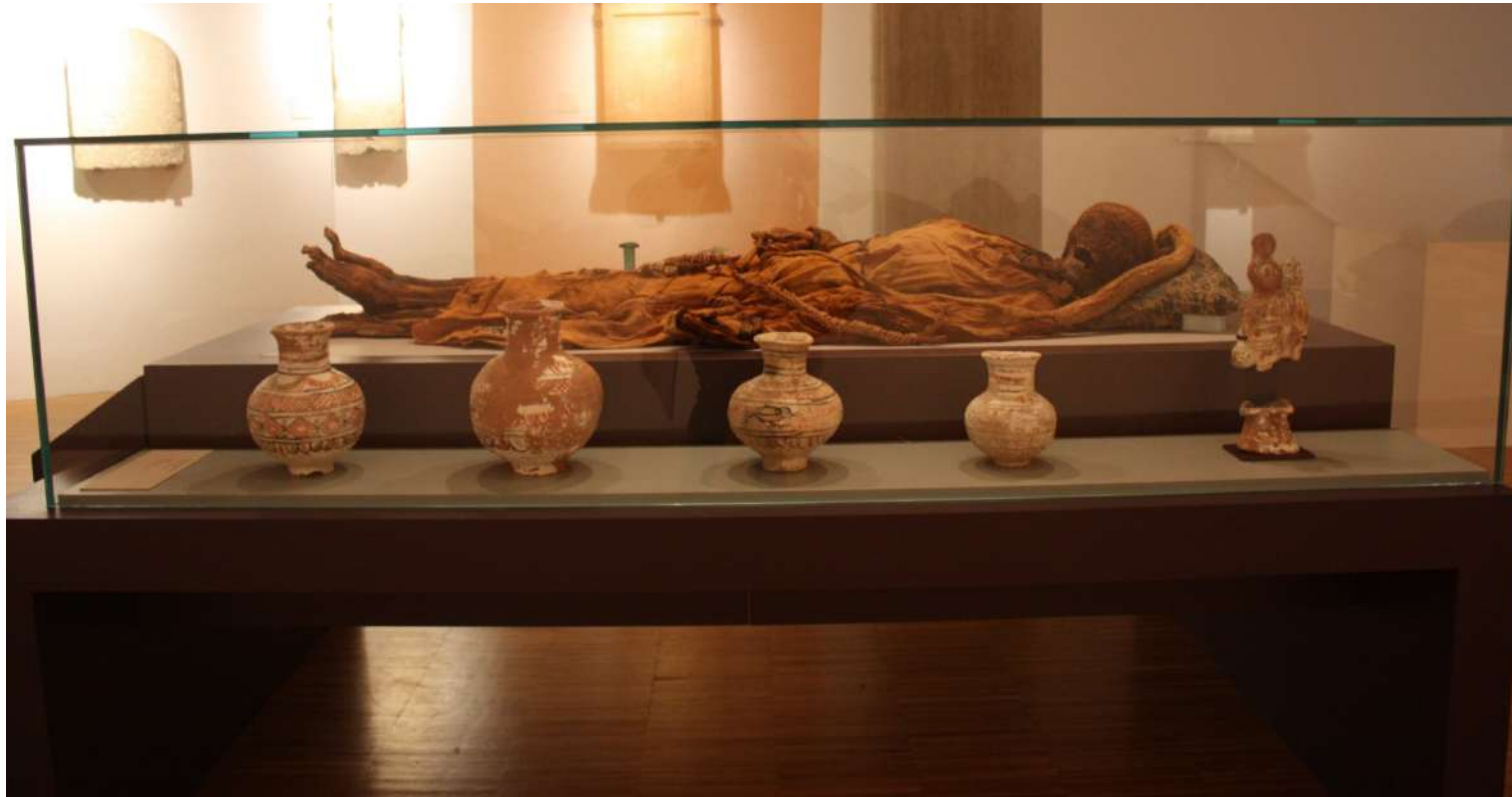
Momie de la prophétesse d'Antinoé - II e siècle - III e siècle fouilles A. Gayet, campagne 1906-1907 -