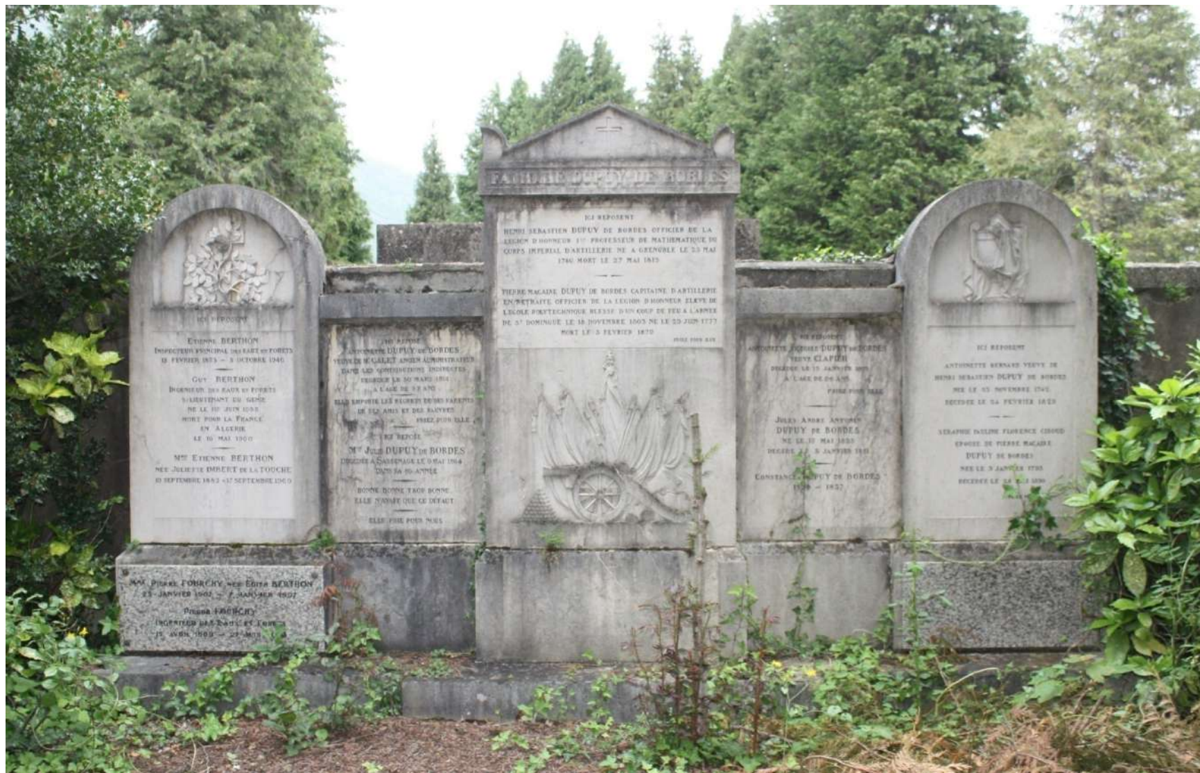
Henri-Sébastien Dupuy de Bordes