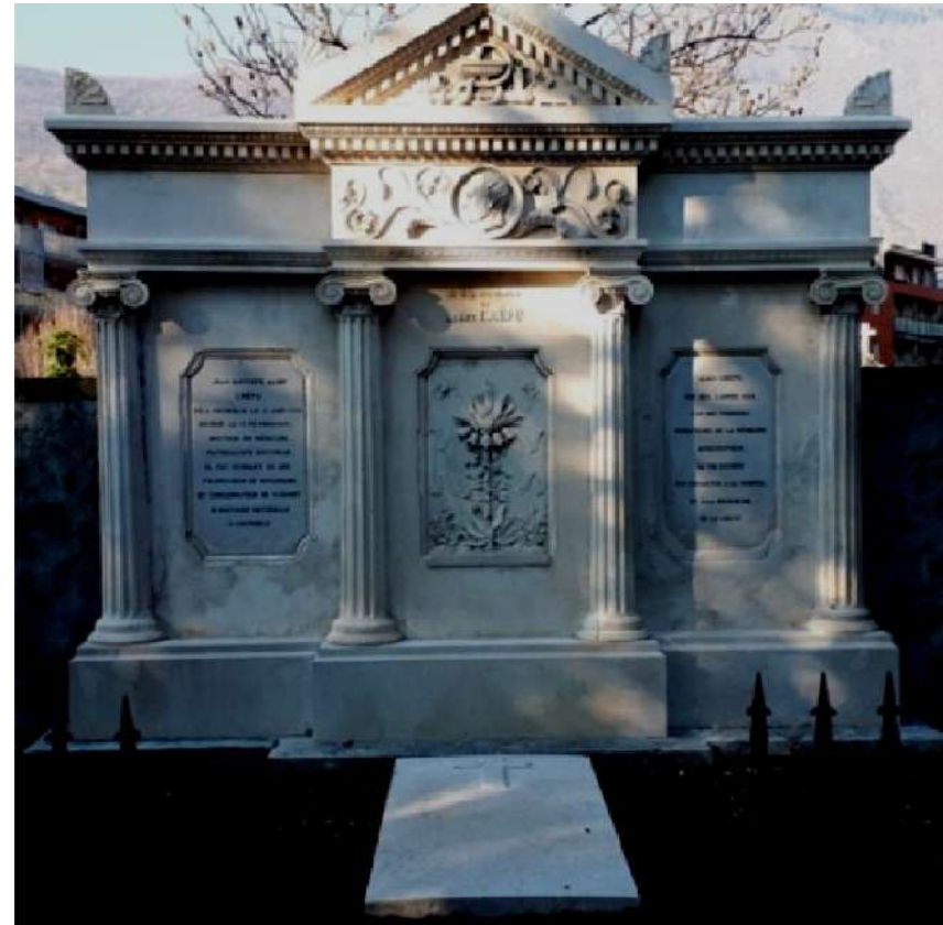
La tombe restaurée en octobre 2021