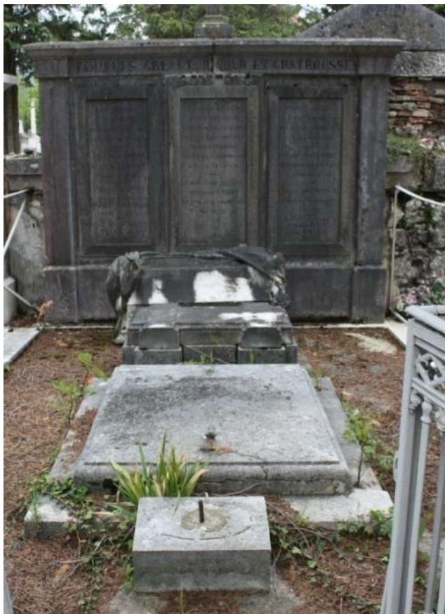
Etat actuel de la tombe