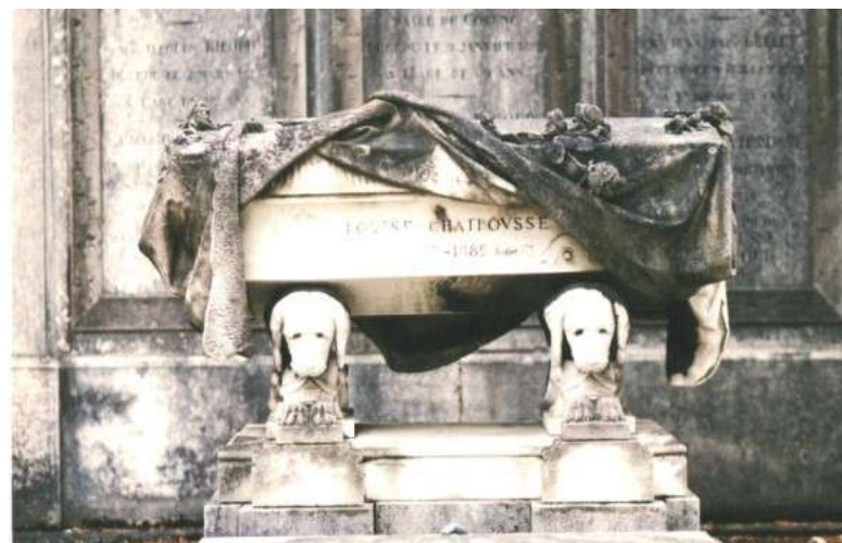
Sarcophage posé sur les sculptures des chiens volées.